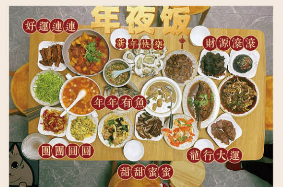
《年夜饭讲究多》

在接到通知放假的时候，一时没有反应过来。当开始整理物品的时候，内心开始蠢蠢欲动。出门的时候，遇到了一个老大爷问了我一句，“回家了啊！”我立马回应，虽然第一次相遇，但是此刻我们能够互相感到对方的喜悦。团聚是每个在外游子的心声。家中父母的关心、妻子的思念，在大年三十这一天都一一圆满。今年的春节是我人生中比较特殊的一次，我有了自己的妻子，我们的新成员，在大家中有了自己的小家。新婚加上新年，幸福满满。（中国建科 成磊）