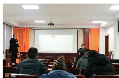
迎宾西路学校项目部组织参加农民工学法活动周讲座