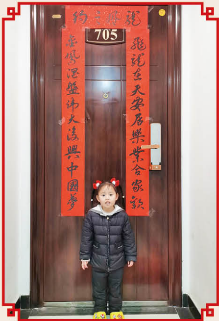
《龙凤之约》