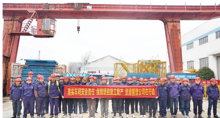
落实车间安全责任 保障项目复工复产 资源管理公司在行动

源管理公司协同项目部，对设备操作人员开展教育培训，提高设备安全意识，讲解设备操作安全要点，交底安全应急措施，确保设备操作安全。资源管理公司时刻待命，夯实安全生产基础，助力安全生产新开局，实现项目复工“开门红”。（资源管理 谭天宇）