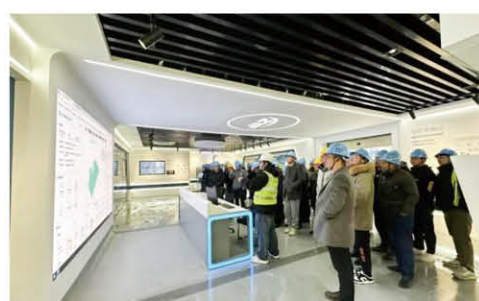
航空航天产业园一期项目复工迎来智能建造观摩