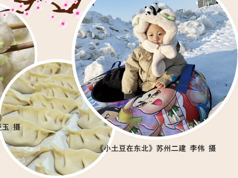
《小土豆在东北》