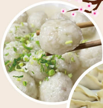
《寿州圆子》