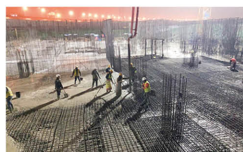
IMS产业园高端制造服务业项目节前连续奋战