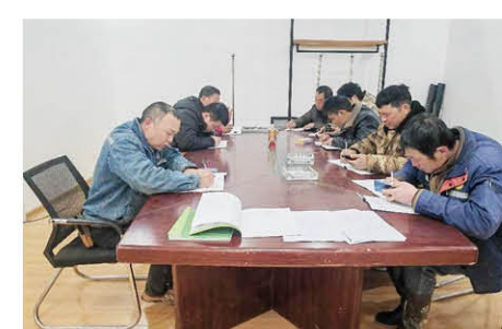
安徽福莱特四期项目部开展安全学习教育