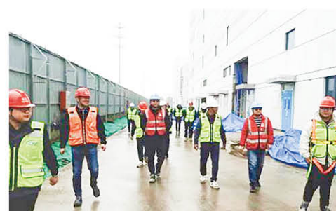
苏州市复工复产调研服务小组走访聚微生物项目