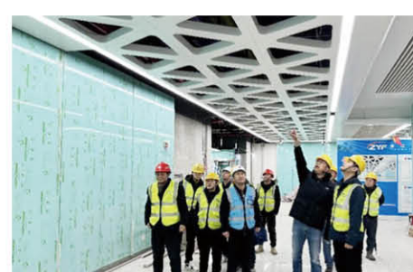
轨道6号线SRT6-13-3标项目部联合复工大检查