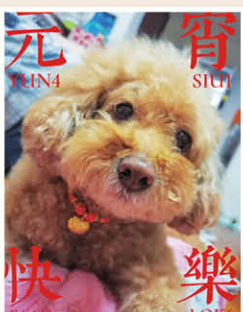
《狗润家肥》

在我的家乡安徽淮南寿县，每到过年，家家户户都会一家齐上阵，准备一顿丰富的年夜饭，其中必不可少的就是做贡圆，《狂飙》中饰演高启强的演员张颂文，就曾在微博中点赞安徽淮南寿县的“寿州圆子”。圆子制作复杂，需要几十道工序。圆子质软不硬、甜滑润喉。一道寿州圆子正是新年一家人团圆、相互理解包容、幸福美满的象征。在整个做圆子的过程中，每个人都能感受到家的温暖和亲人之间相守的幸福。（中亿丰光电 吴曼玉）