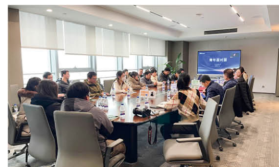
EPC 公司组织青年面对面交流会