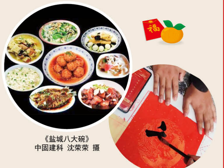
《盐城八大碗》