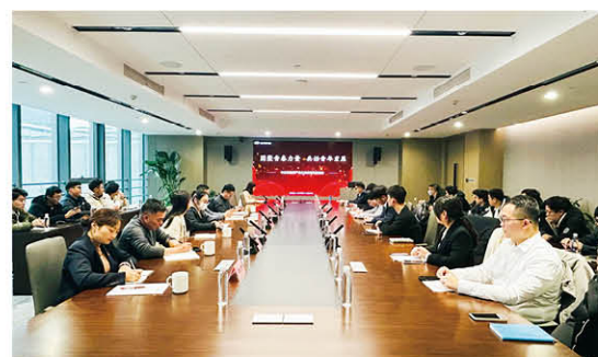
中亿丰建筑产业化公司青年年终座谈会