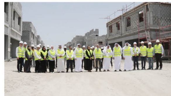
巴林住房部部长视察一期项目施工现场