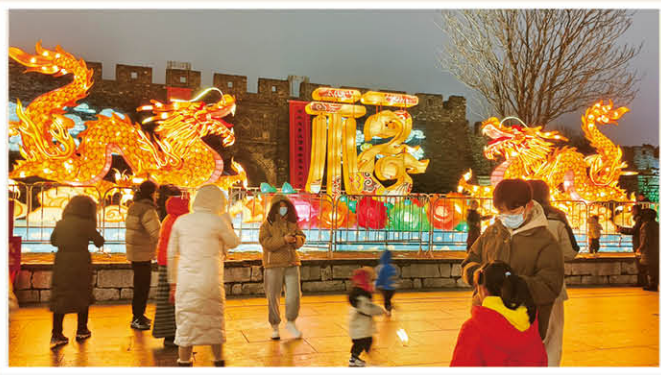
《古城新气象》 中亿丰建设党综办 后永义 摄

导语：2024，甲辰龙年。中国人是龙的传人，龙是中华民族的象征和精神图腾。龙的形象庄严祥瑞而富有神通，传说是由各个部族图腾的一部分组合而成，古人说：“角似鹿、头似驼、眼似兔、项似蛇、腹似蜃、鳞似鱼、爪似鹰、掌似虎、耳似牛”，代表中华民族的融合与统一。因此，龙从形象到内涵都体现出“和合”的特征……和而不同、兼收并蓄、和协万邦、和睦吉祥。中亿丰推崇和合文化，中亿丰人从天南海北会聚，为了企业的社会理想又奔赴四面八方。在这个春天，他们也把最美的记忆带给大家，愿我们像这个春节档热映的贾玲电影一样，在热辣滚烫的生活中追逐内心的热情与梦想。