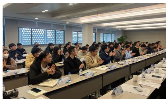
基础设施公司青年座谈会