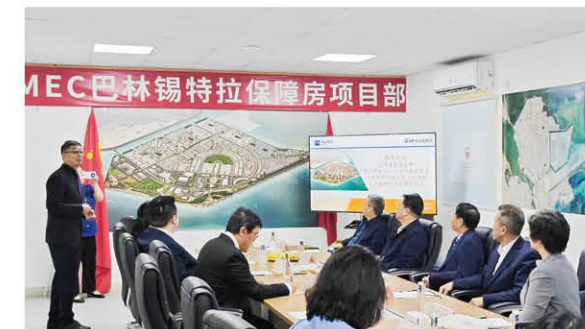
江苏省政协主席及中国驻巴林大使视察一期项目工地