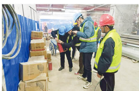
尼盛中心幕墙项目部联合总包监理单位进行全面安全检查