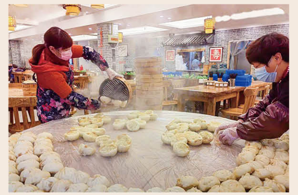
《热气腾腾》中亿丰科工