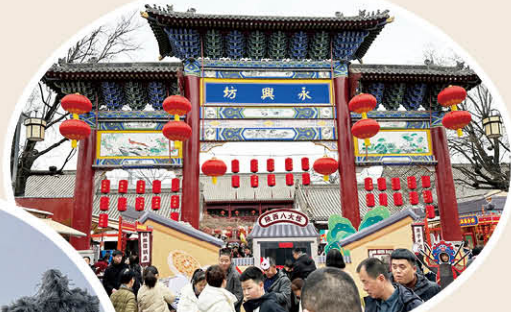
《西安赶庙会》 中亿丰建筑产业化 张悠 摄