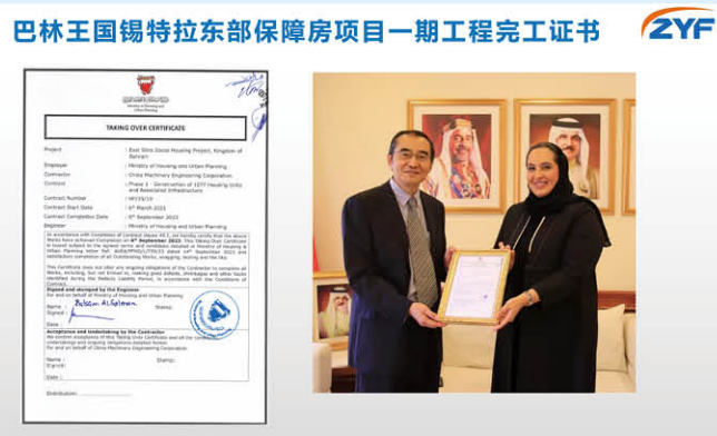
巴林住房部部长向中方代表授予“巴林锡特拉保障房一期项目”移交证书

of Zhongyifeng Construction Investment, Construction and Operation Integration, and in accordance with the holding group's "14th Five Year Plan" strategic plan, Zhongyifeng Holding Group has decided to establish a unified management department for overseas businesses - the International Business Management Department of Zhongyifeng Holding Group. The unified management at the controlling level will further promote the integration of "three manufacturing", deepen the upgrading of "three capital", strengthen the coordination of "three chains", optimize resource allocation, and at the same time play a better role in overall planning and promotion by leveraging the maximum advantage of product and service integration of Zhongyifeng series.