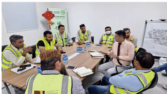
中亿丰团队参加由业主监理及分包商共同参与的市政标段质量讨论会

路漫漫其修远兮，中亿丰团队将继续上下探索国际化之路。我们看到了新一代中亿丰工程师给我们带来的希望，展望未来，我们将持续努力。就像中亿丰工程师参加巴林华侨商活动照片中每个成员脸上展现的笑容，国际化未来之路属于愿意奋斗且持续提升的新一代中亿丰工程师。