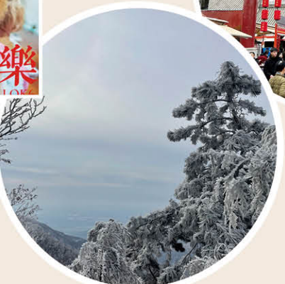
《花果山奇观》