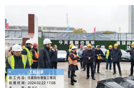
苏州市住建局、太仓市住建局领导在太仓时代金融大厦项目复工调研