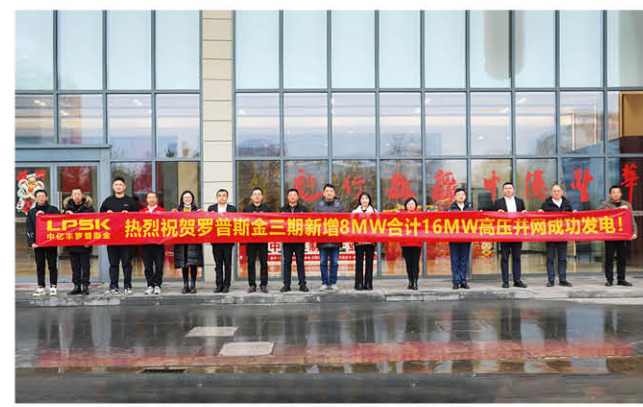
厂”向“近零碳工厂”迈进的步伐。（中亿丰光电 陈金斌）

在“30·60”双碳目标驱动下，中亿丰积极向“绿”而行，罗普斯金三期光伏项目建成，企业将实现“轻”耗能发展，为企业绿色生产提供引擎，加速中亿丰罗普斯金从“绿色工