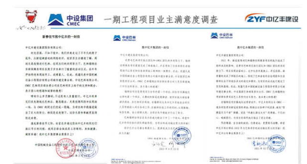
中亿丰巴林团队荣获委托方感谢信