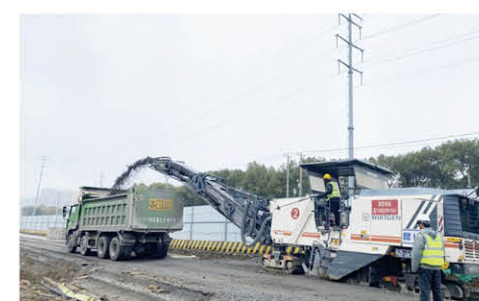
X203澄阳路项目复工旧路铣刨工作