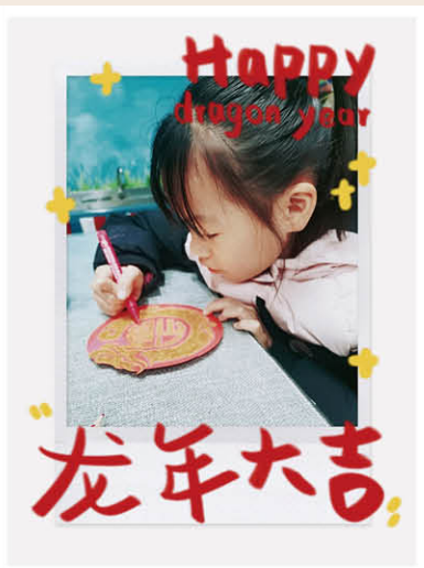
《画条金龙送给你》

张灯结彩庆佳节，巨龙腾飞新征程。愿我们中亿丰以龙腾四海的气势、龙腾虎跃的干劲、生龙活虎的精气神顽强拼搏、勇毅前行，在推动高质量发展中不断增进民生福祉，让老百姓的生活越来越红火，日子过得更好，奋力谱写中国式现代化的新篇章！（中亿丰EPC 张璐璐）